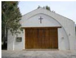
Kapelle in der Cala Murada

Ja was hat denn die Kapelle in der Cala Murada mit Wellness zu tun? Erholung für den Geist - für die Seele!?! Wie auch immer - auch das ist sicherlich ein Angebot was grundsätzlich dazu gehört. Die Kapelle ist auf unserer Übersichtskarte der Cala Murada mit der 14 gekennzeichnet.